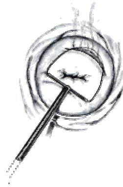
Konisatsiooni teostatakse elekterlinguga

Nagu kõikide kirurgiliste operatsioonide puhul, võib ka emakakaela konisatsiooniga kaasned tüsistusi. Üks võimalikest tüsistustest on verejooks vahetult pärast operatsiooni või hilisemas perioodis (1 – 2 nädalat peale operatsiooni). Tekkinud verejooks võib vajada korduvat õmblemist või koaguleerimist (kõrvetamist). Kui eemaldatud koetükk oli suur, võib konisatsioonijärgselt tekkida emakakaela puudulikkus. Emakakaela puudulikkuse korral on oluliselt suurem risk raseduse katkemiseks ja enneaegseks sünnituseks. Emakakaela puudulikkust saab raseduse ajal korrigeerida emakakaelale tugevdava õmbluse asetamisega. Üldjuhul kulgeb rasedus selle protseduuri järgselt normaalselt. Elekterlingu kasutades võib tekkida naha kahjustus (arm) elektroodi piirkonda. Harva esinev tüsistus on allergiline reaktsioon narkoosi ravimitele. Operatsioonile saabudes peate olema vähemalt 6 tundi söömata – joomata. Ei tohi suitsetada, ega närida närimiskummi.